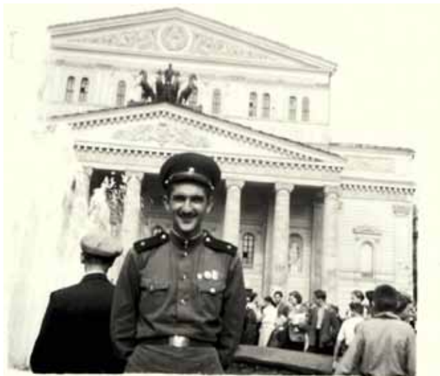
Отпуск на сутки в Москву. 03.10.1955 г.