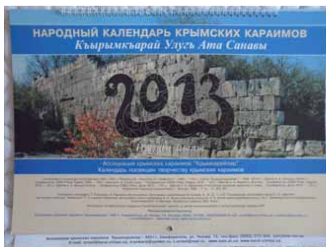
Народный календарь крымских караимов

Главный редактор – О.В. Петров-Дубинский Зам. главного редактора – А.А. Бабаджан Члены редколлегии: И.М. Реброва, И.Б. Новак, Б.С. Таймаз Вёрстка Г.А.Бабаджана (Симферополь)