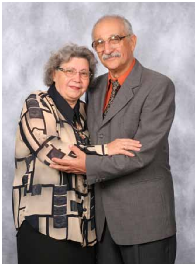
50 лет вместе

После увольнения из армии Шпаковский поступил на работу на Вильнюсский завод радиоизмерительных приборов. Он работал конструктором, а затем руководителем группы по проектированию технологической оснастки. Без отрыва