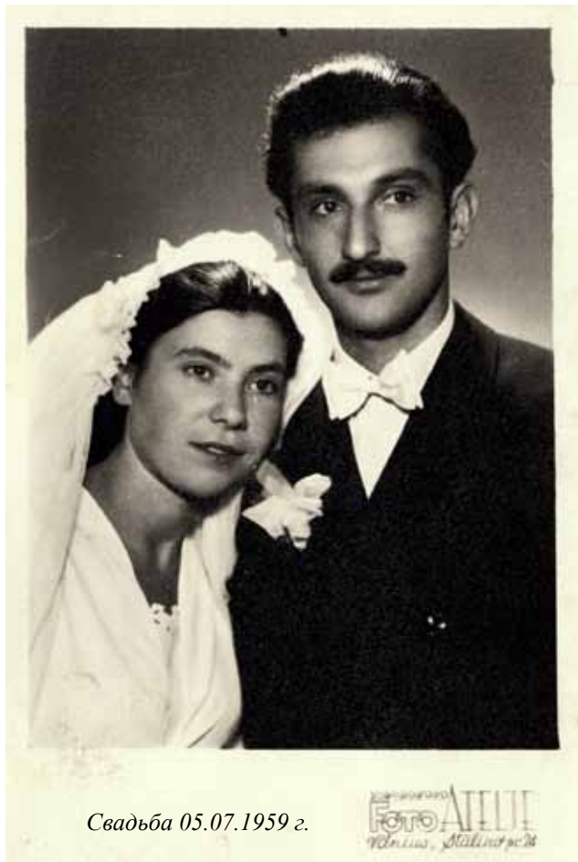
Свадьба 05.07.1959 г.