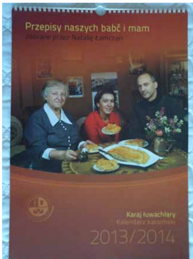
Календарь караимов Польши и Литвы

Календарь получился очень необычным по содержанию и профессионально оформленным в коричнево-красной цветовой гамме. Он несомненно украсит домашний интерьер и будет полезен любой хозяйке, любящей готовить вкусные блюда.