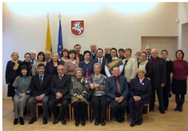
В Доме национальных меньшинств снимок на память с юбиляром и вице-министром культуры Литвы