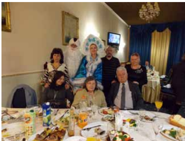
С гостями, Дедом Морозом и Снегурочкой