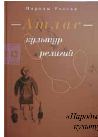
«Народы России. Атлас культур и религий»

Как видно из этой небольшой статьи, её авторы весьма поверхностно знакомы с историей крымских караимов и не обращались за информацией к их представителям. Они элементарно перепутали крымскокараимский автохтонный народ с его единоверцами в Израиле. Какие 20 тыс. человек сосредоточились к середине 1980-х годов в Израиле, если во всём мире крымских караимов насчитывается не более 2400 человек?! В те годы в Израиле ещё не было даже десятка крымских караимов, эмигрировавших туда из Крыма по экономическим причинам в тяжелейшие 1990-е годы. А как авторы атласа умудрились с такой точностью подсчитать количество караимов в России (366 чел.), если даже сами караимы не знают точно этой цифры? О последней фразе статьи («...представляют собой крымскую группу евреев») и говорить не приходится. Абсолютно ненаучное и некорректное выражение, взятое, очевидно, из самых махровых антикараимских источников. Даже крымчаки, исповедующие иудаизм, не являются семитами. А уж крымские караимы ни по вере, ни по всем остальным характеристикам не относятся к семитской группе народов. Это было